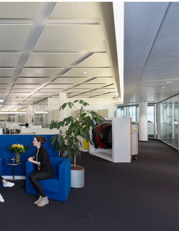
▶ Sicht auf die Redaktionen mit integriertem Newsroom.

die neue, identitätsstiftende Gebäudeentwicklung mit anschließendem Umzug ist bei einem gestarteten Change Prozess eine tatsächlich von jedem spürbare Veränderung.